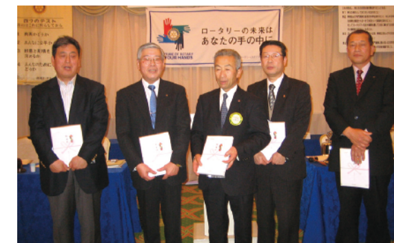
1月に誕生日を迎えられる会員