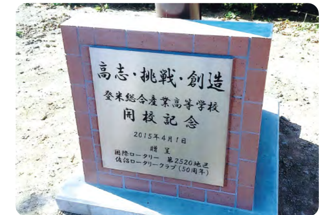
3つの校訓、下部には「2015年4月1日佐沼ロータリー クラブ(50周年)」と刻まれています