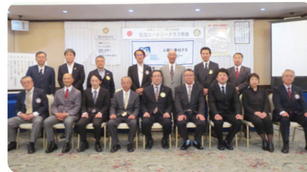
受賞者の皆さんと記念撮影

正式名称は、登米ジュニア吹奏楽団です。これは、迫吹奏楽団の演奏会の時に、11年前ですが地域の子もたちとステージを一緒にしたいということから出来ました。地域の小・中学校の先生たちと比較的コンタクトがとれていたので、学校の方からは気持ちよく生徒たちを出してもらえ、毎年30人位の子もたちと我々社会人の演奏家たちが一緒になってステージを積み上げて参りました。現在は41名で活動しております。3月26日(日)デビューコンサートをする計画を立てております。イオンのセンターコートをお借りして、午前11時半と午後2時の2回演奏を行います。お顔を出していただければ子どもたちも喜ぶことと思います。今日は、ありがとうございます。