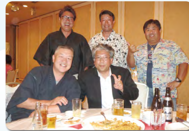
若手の会員も大満足