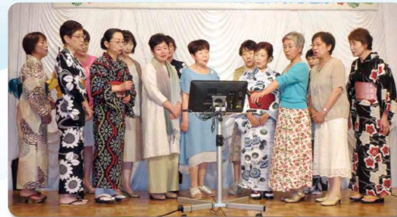
会員夫人のハーモニーもバッチリ！