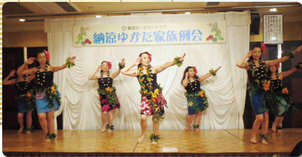
マナリアフラダンスサークルの皆様の素晴らしいダンス！