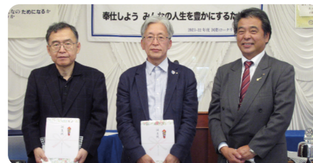
6月に誕生日を迎えられる会員